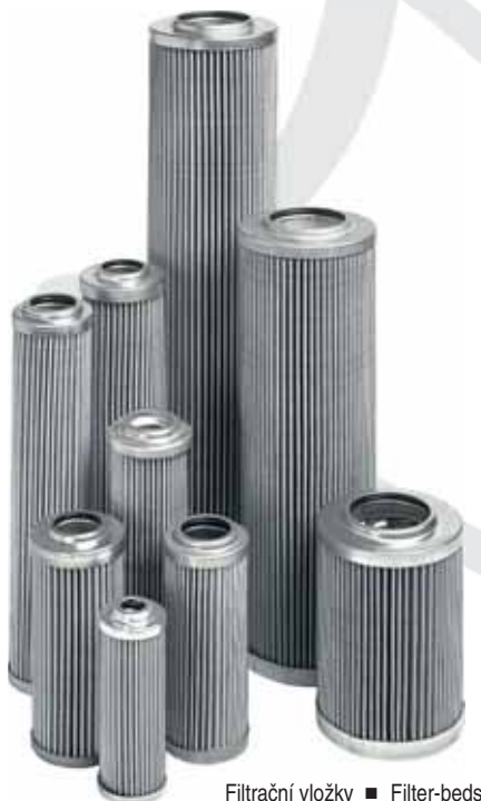
Filtrační vložky ■ Filter-beds