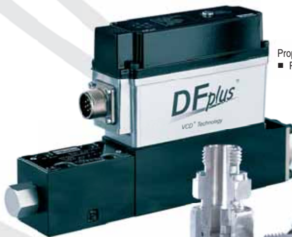
Proporcionální rozvaděč DF plus ■ Proportional distributor DF plus