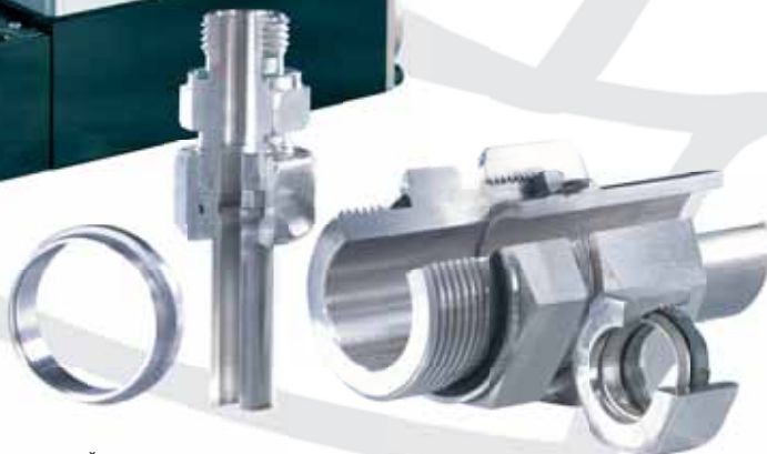
Šroubení ■ Pipe unions